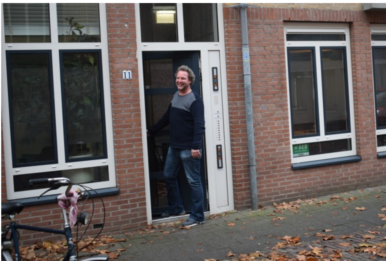
Het Wegloophuis aan de Waterstraat in Wijk C, er is plek voor 6 bewoners